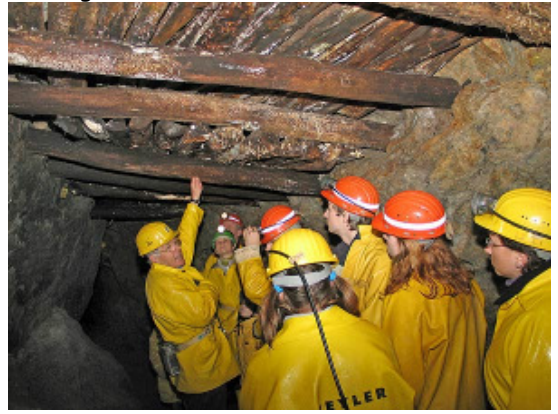
Aber auch das Besucherbergwerk „Segen Gottes“ in Haslach-Schnellingen und das Mineralienmuseum in Oberwolfach sind für Mineraliensammler ein MUSS.

Weitere Tipps für Mineraliensammler: Besucherbergwerk "Grube Wenzel" in Oberwolfach