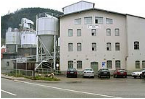
Die Werkshalden auf dem Betriebsgelände sind gegen eine Gebühr von Euro 7,- an Werktagen zugänglich.

Als Mineraliensammler kennen wir die lokalen Mineralienvorkommen im Schwarzwald. Wir geben gerne Informationen zur Geschichte des Bergbaus im Schwarzwald. In der näheren Umgebung von Tennenbronn befindet sich die Grube Clara. Einer der bedeutendsten Mineralienfundorte im Schwarzwald.